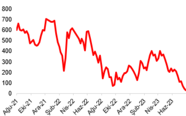
— Etilen nafta makası

(=/-) PETKM: Etilen - Nafta makası... Etilen-nafta makası, 11 Ağustos 2023 tarihi itibarıyla haftalık bazda 12,00 USD daha azalarak 29,20 USD/tona geriledi. Makas geçtiğimiz 3 haftada toplam 86,80 USD azalış göstermiş oldu. Etilen fiyatındaki sınırlı artışa (+%0,6) karşılık nafta fiyatının güçlü şekilde artması (+%2,5) makasın bu hafta daralmasında etkili oldu. Platts Küresel Petrokimya Endeksinde son haftalarda kısmi bir yükseliş eğilimi dikkat çekmekte. Öte yandan etilen-nafta makası 3. çeyreğin ilk 6 haftasında ortalama 88,35 USD/ton olarak gerçekleşti. Petkim'de operasyonel karlılık için kısmi bir göstere olarak takip edilen etilen-nafta makası 2Ç23'te ortalama 281,8 USD/ton ve 3Ç22'de ortalama 246,8 USD/ton düzeyindeydi. Dolayısıyla operasyonel karlılıkta kısa vadede hızlı bir toparlanma beklemiyoruz.