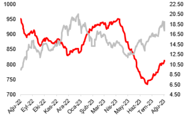
— Petrokimya Endeksi — PETKM Hisse Fiyatı (Sağ eksen)